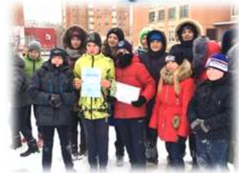
Игра «Зимние забавы»