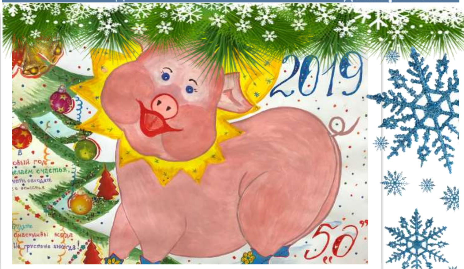
Стенгазета 5 «Д» класс

Здравствуй, наши дорогие читатели. Уже прошло целых полгода с того момента, как мы начали учиться в нашей замечательной школе в этом учебном году. На дворе декабрь, время волшебства и новогодних чудес, исполнения желаний и подарков от Деда Мороза. Ну и, конечно, как мы можем забыть про самую главную красавицу любого новогоднего торжества – Елку? В течение всего месяца мы находимся в очень позитивном и насыщенном настроении.