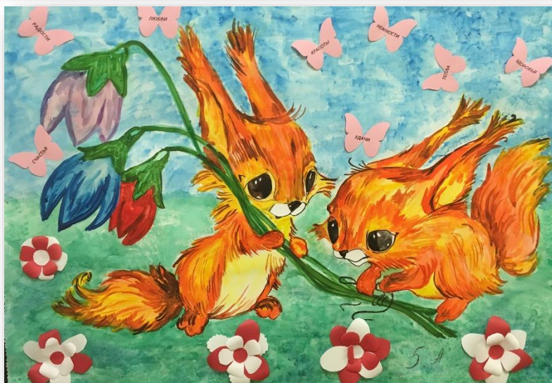
Творческий коллектив 5 «А» класса

В этот день мы от всей души поздравляем дорогих мам с их праздником. Дорогие наши любимые мамы! Пусть светом и добром отзываются в душах детей ваши бесконечные заботы, терпение. В этот день хочется сказать слова благодарности всем Матерям, которые дарят детям любовь, добро, нежность и ласку. Спасибо вам, родные!