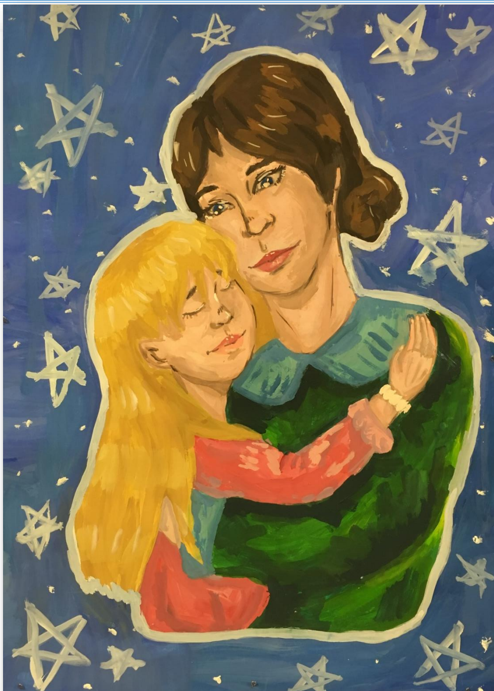
Творческий коллектив 9 «А» класса