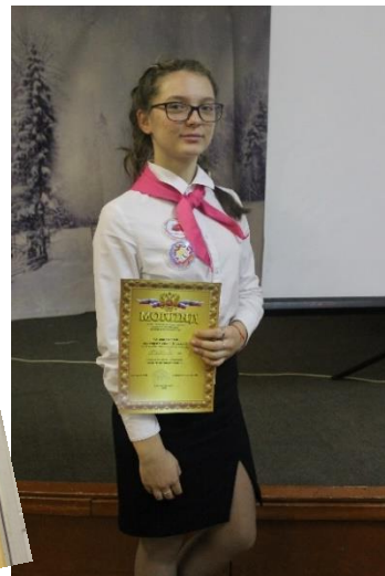
Разворот подготовлен активом ДО «Алые паруса»