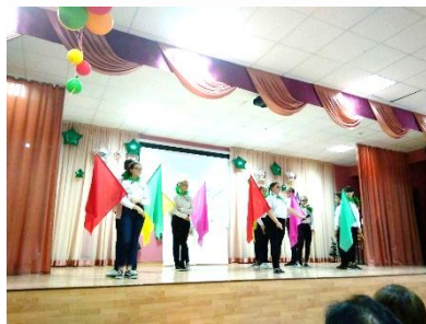
Творческий коллектив агитбригады «Экологический десант»