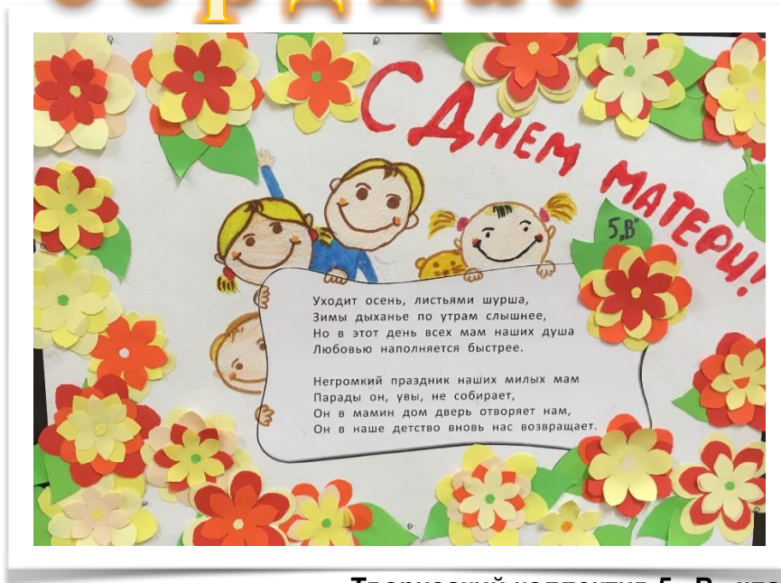
Творческий коллектив 5 «В» класса