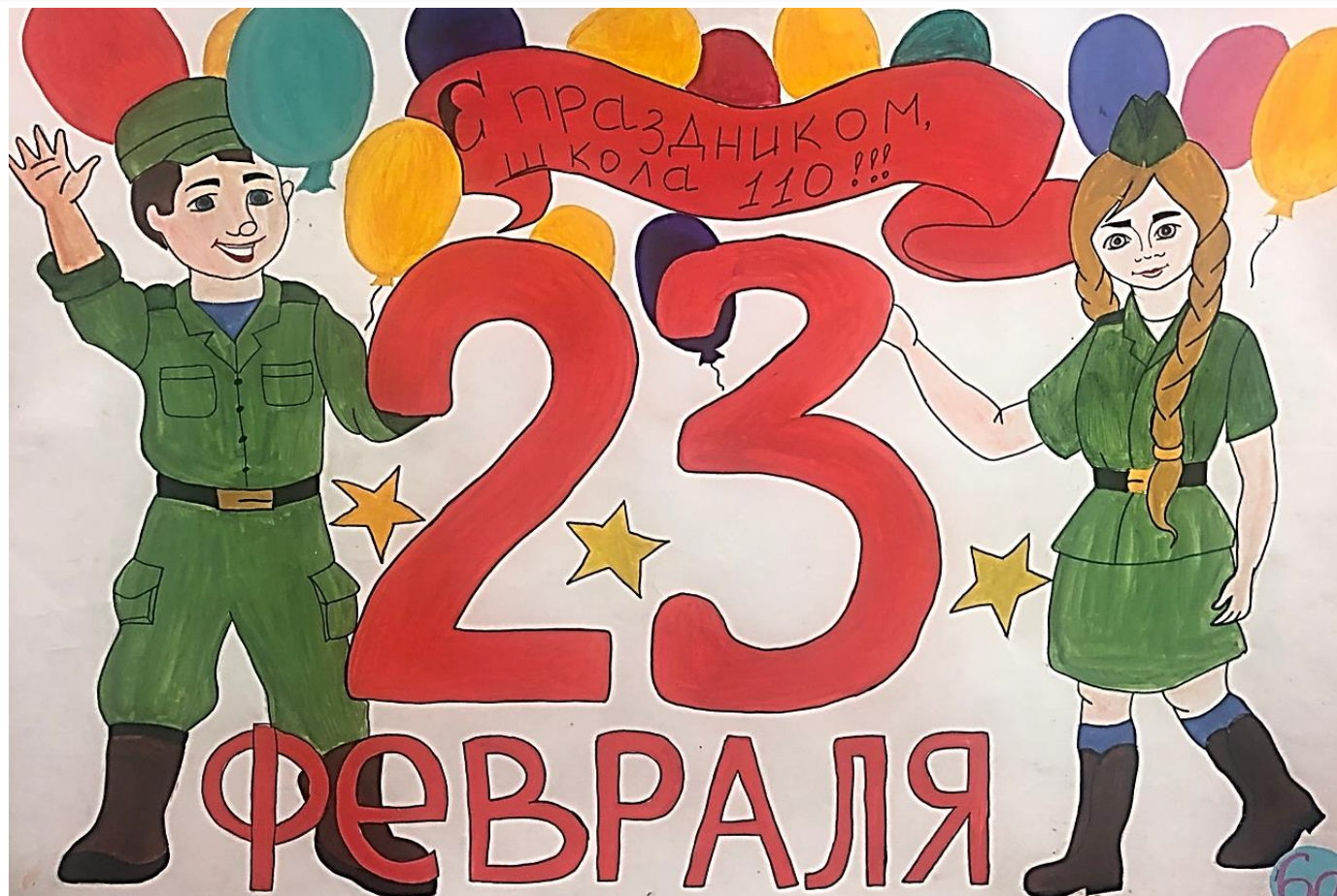
Стенгазета, 6 «А» класса

23 Февраля — любимый праздник мужчин и день, к которому любящие женщины начинают готовиться практически сразу же после новогодних праздников. День защитника Отечества считается праздником воинов - настоящих, нынешних и будущих.