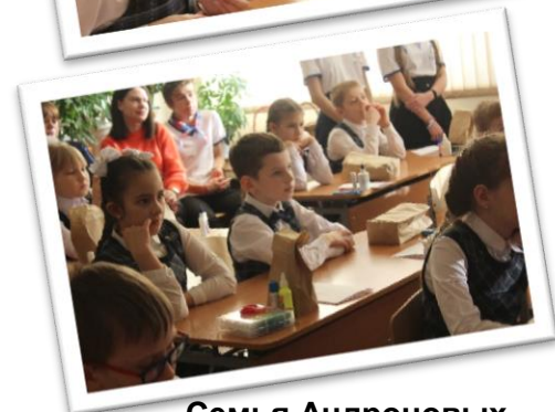
Семья Андроновых, 2 «А» класс