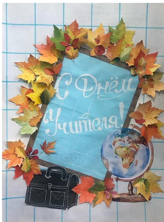
Стенгазета, учащихся 8 «Б» класса