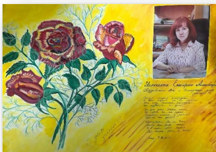
Стенгазета, учащихся 3 «Д» класса