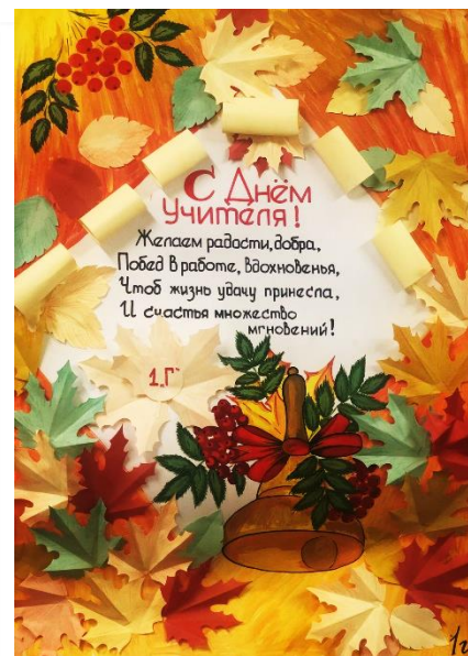
Стенгазета 1 «Г» класс